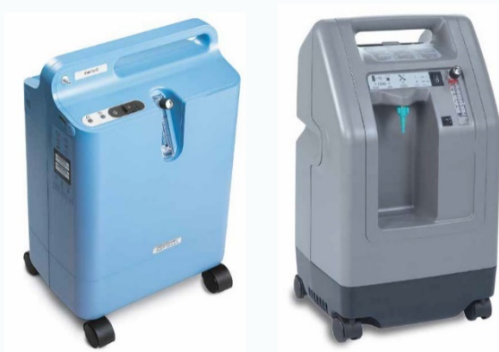
Vaste zuurstofconcentrators.

✓ Concentrator: mag vervoerd worden in de auto, bus, trein of boot. De vaste concentrator kan handig zijn wanneer u gedurende een bepaalde periode buitenshuis verblijft. Tijdens het transport kan gebruik gemaakt worden van een draagbaar gasflesje of een draagbare concentrator. Indien u met de auto reist, kan de draagbare concentrator gekoppeld worden aan de 12V-autolader zodat de batterijcapaciteit stabiel blijft.