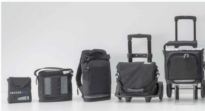
Draagbare zuurstofconcentrators.